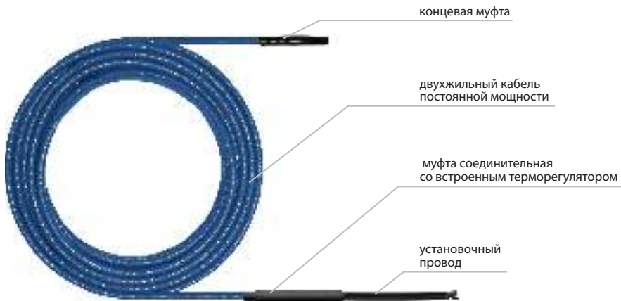
Рис. 1. Конструкция нагревательной секции

Нагревательный кабель состоит из двух нагревательных жил в экране и оболочке. Соединительная и концевая муфты изготовлены в заводских условиях, надежны и герметичны.